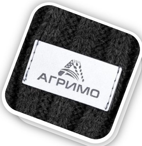
Лейбл светоотражающий Tao, S Артикул 15943