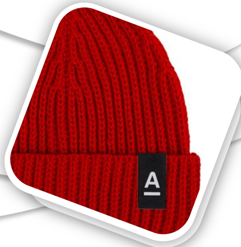
Лейбл тканевый Epsilon, S Артикул 13940