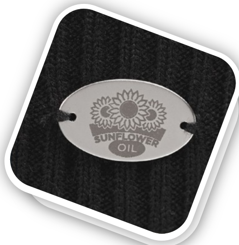
Шильдик металлический Alfa Oval Артикул 13843