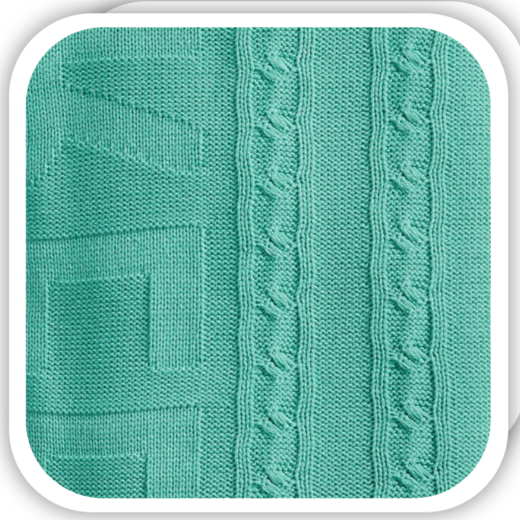
Плед на заказ Pleat Plus Артикул 18027