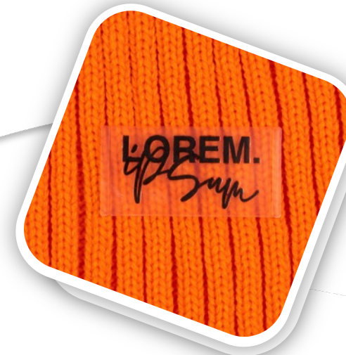
Лейбл из ПВХ Dzeta, S Артикул 13916