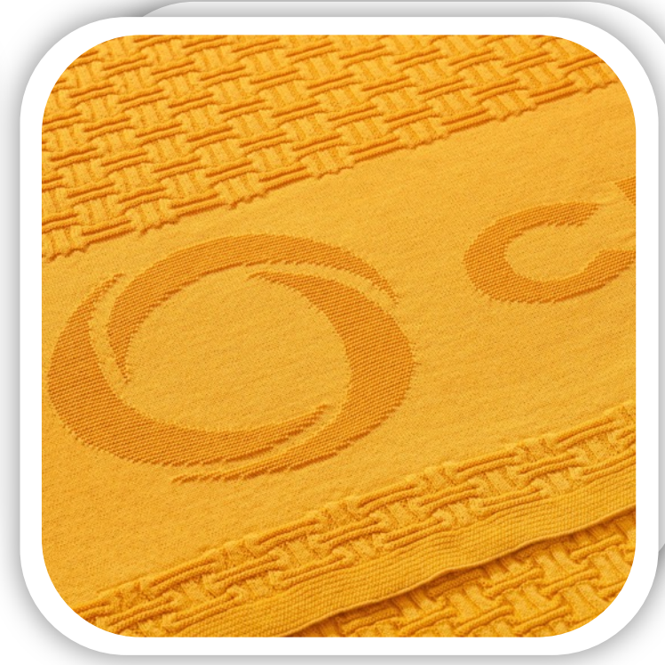
Плед на заказ Basket Артикул 18049