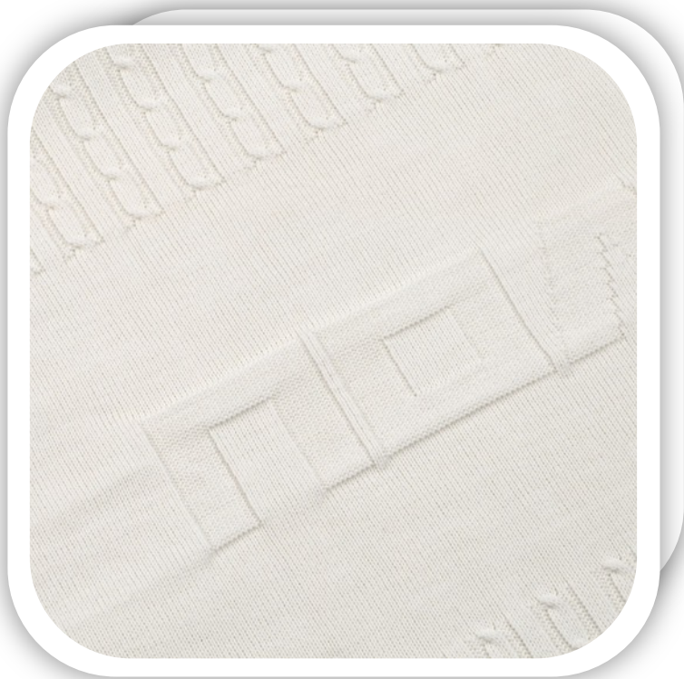
Плед на заказ Remit Plus Артикул 18023