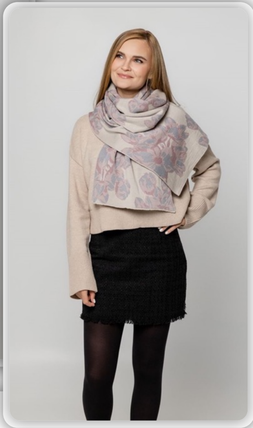
Шарф на заказ Tricksy Light, XL