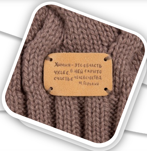
Лейбл кожаный Beta, S Артикул 13845