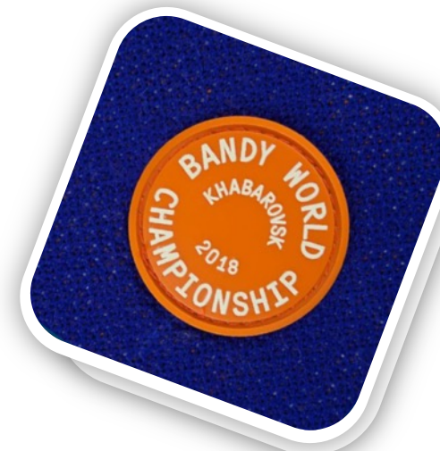
Лейбл из ПВХ Dzeta Round, L Артикул 15354